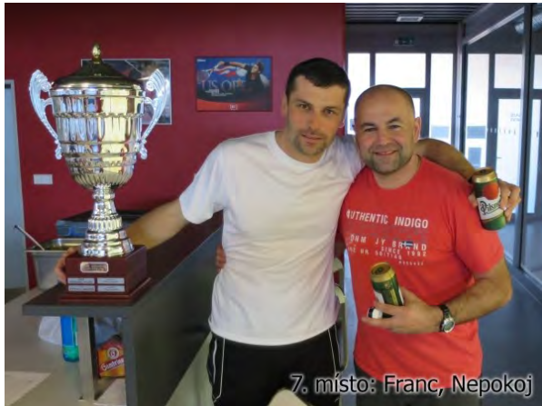
7. místo: Franc, Nepokoj